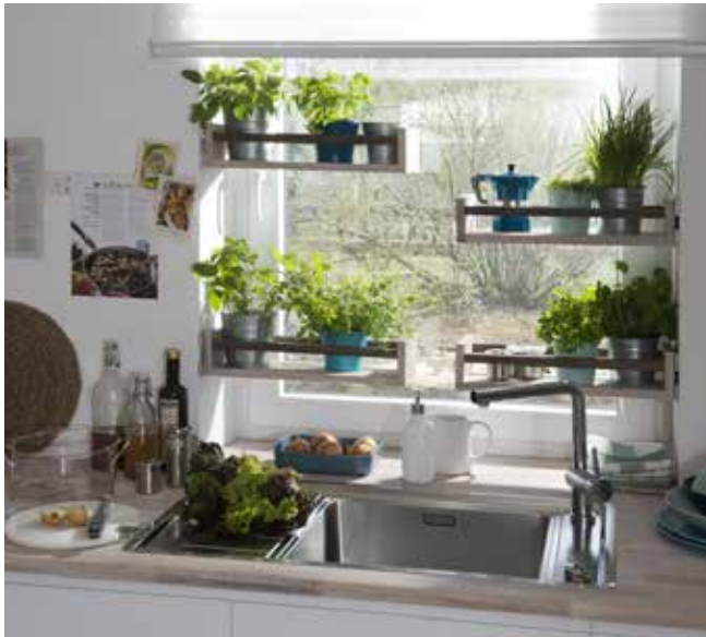
Produktion und Fotos: Living Art