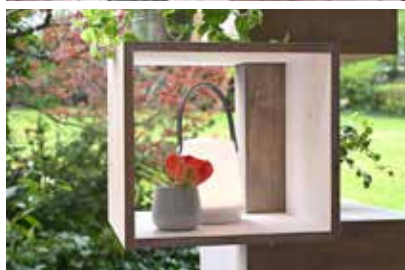
Die offenen Boxen sind aus vier Holzteilen gefertigt.