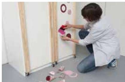
11. Zusätzlich verschönern Punkte und Ringe aus verschiedenen Folien die Front.