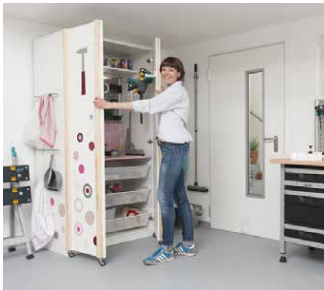
Konzeption und Fotos: Living Art

Als Grundlage für dieses übersichtliche Heimwerkermöbel dient ein Ikea-Schrank, der mit wenigen Handgriffen umgerüstet wird. Bunte Applikationen auf den Türen können nach Wunsch gestaltet werden, genauso wie die Innenausstattung mit Lochwand und Ablagekörben.