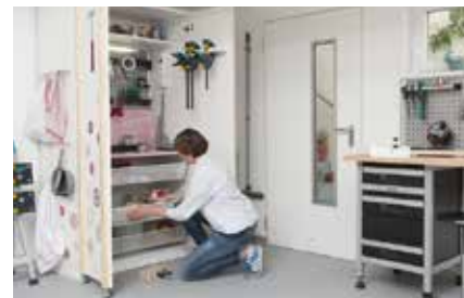
12. Ganz nach Bedarf können seitlich Griffe als Aufhängung angebracht werden. Auch ein Bord für Zwingen an der Türinnenseite ist praktisch.