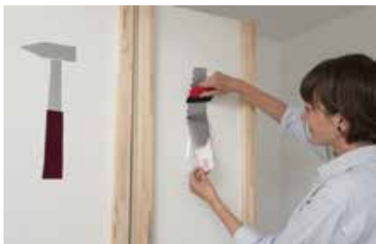
10. Das Aufkleben erfolgt ebenfalls mit der Rakel.