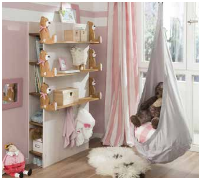
Produktion und Fotos: Living Art