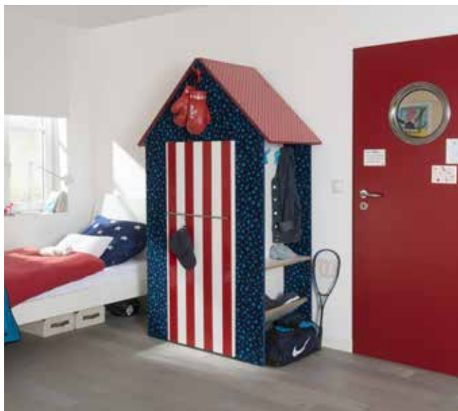
Produktion und Fotos: Living Art